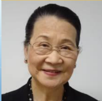
野村 豊子先生 日本福祉大学教授